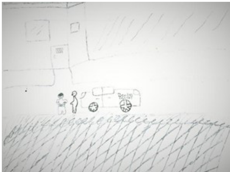
Imagen 4 y 5. Imagen de aquellos que pasan.