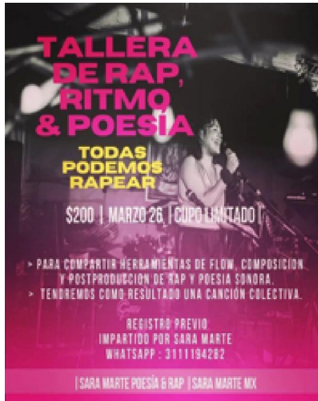
Figura 2. Cartel para taller con Sara Marte, marzo 2022.

Cuando conocí a Sara Marte, me habló un poco de la experiencia de la gestión y de la necesidad de crear sus espacios. Ella, como artesana textil, se ha ocupado de adecuar su taller con micrófono y bocinas para sentirse dentro de un espacio donde sea posible crear.