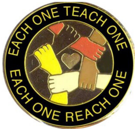
Ilustración 3. Each one Teach One, Each One Reach One. Imagen utilizada por la Zulu Union.

No obstante, también el conocimiento callejero