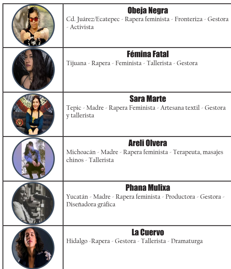
Tabla 1. Caracterización de las raperas entrevistadas.

politizadas que cuestionan y resisten ante un sistema patriarcal, capitalista y adultocentrista que las condicionan por el hecho de ser mujeres. Recordemos entonces que, si el género y la juventud son categorías a las que podemos dotar de significación, dependiendo del contexto político e histórico (Viera, 2017), entonces, el ser mujer joven va a adquirir otras herramientas para construir su discurso y sus prácticas ante lo masculino.