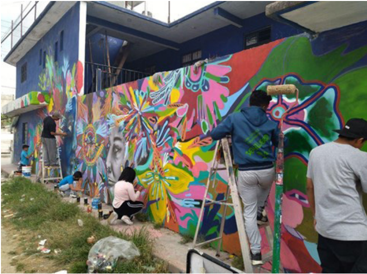
Ilustración 1. Mural colectivo, realizado por el Semillero 259 y el colectivo GAM (Grafiti/Arte/Mural), abril 2023.