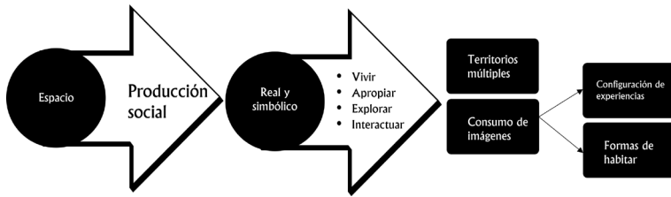
Ilustración 1. Formas en las que se configura el espacio de los jóvenes que consumen TikTok .