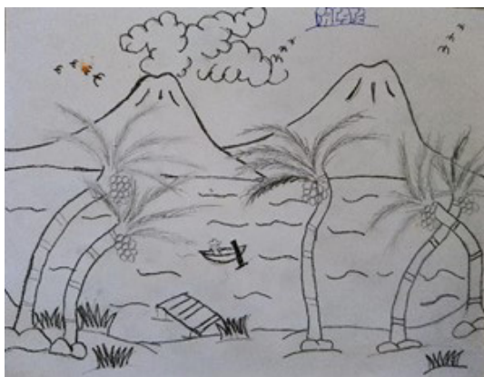
Imagen 1. Dibujo realizado por un joven en movilidad.

Fuente: Juan, 16 años, guatemalteco. (realizado en un albergue en febrero 2019)