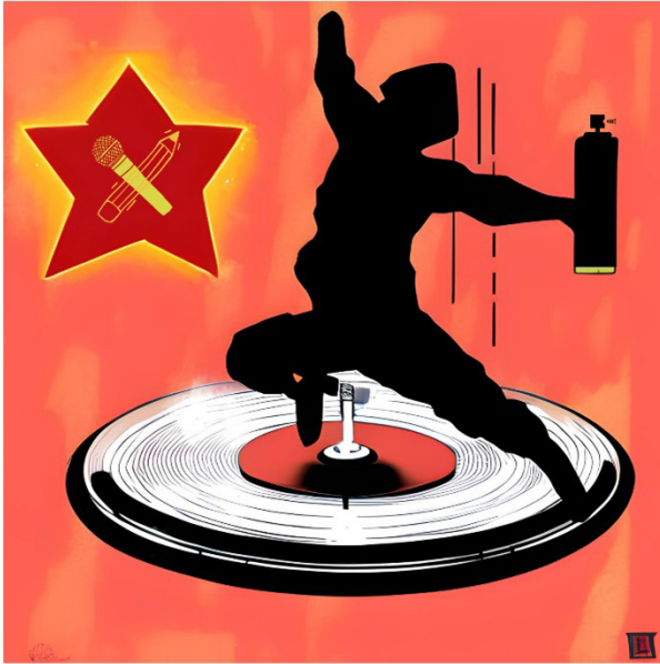
Ilustración 2. Los cuatro elementos principales del hip-hop más el conocimiento. Ilustración creada por IA e intervenida por mí.

La pedagogía del hip-hop se basa en la idea de que la cultura y el arte pueden ser utilizados como herramientas