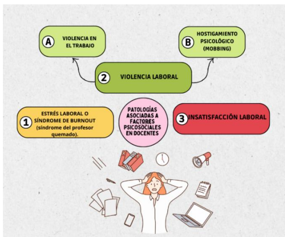
Figura 1. Patologías asociadas a factores psicosociales en docentes